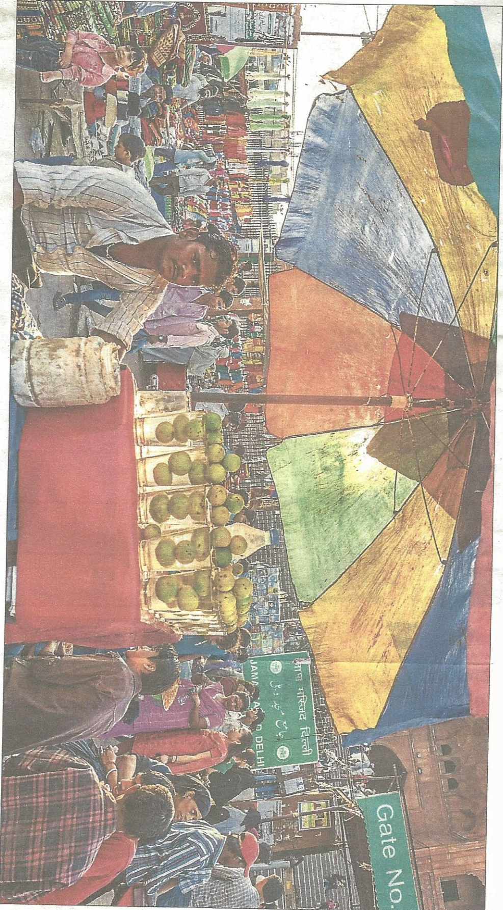
sch geröstete Brotfladen gibt's an jeder Ecke. Zitronenlimo im Meena-Basar aus dem 17. Jahrhundert (gr. Foto). Der 73 Meter hohe Wachturm der Quwwat-ul-Islam-Moschee aus dem 13. Jahrhundert.